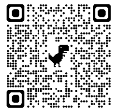
報名連結 QR Code