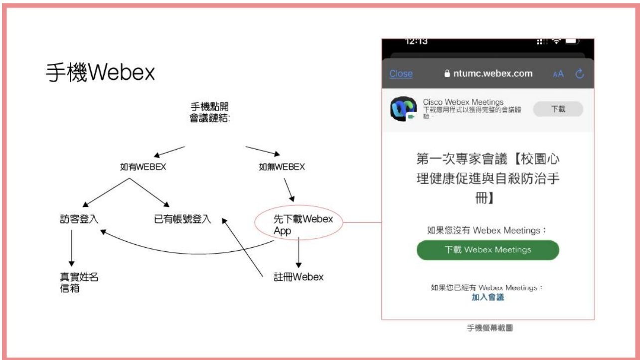
Figure 2 簡易手機版 Webex 加入會議說明。